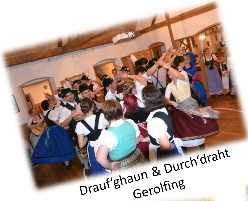
Drauf'ghaun & Durch'draht Gerolfing