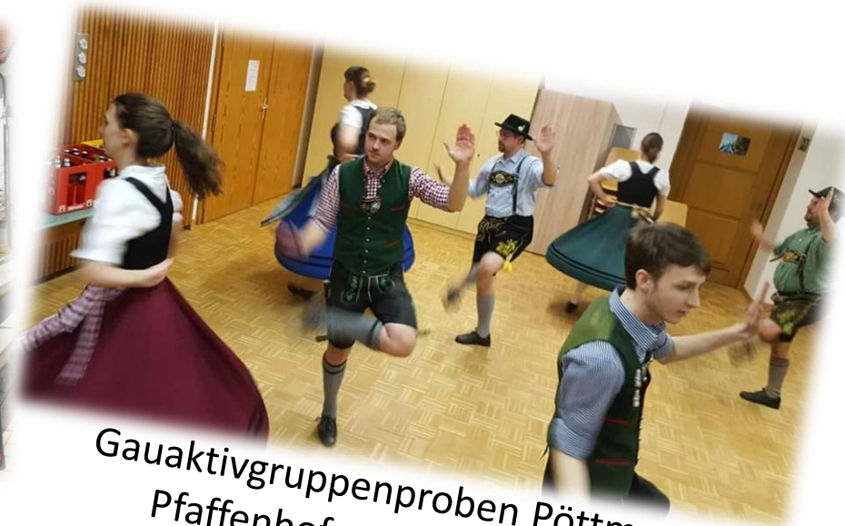
Gauaktivgruppenproben Pöttmes, Pfaffenhofen und Gerolfing