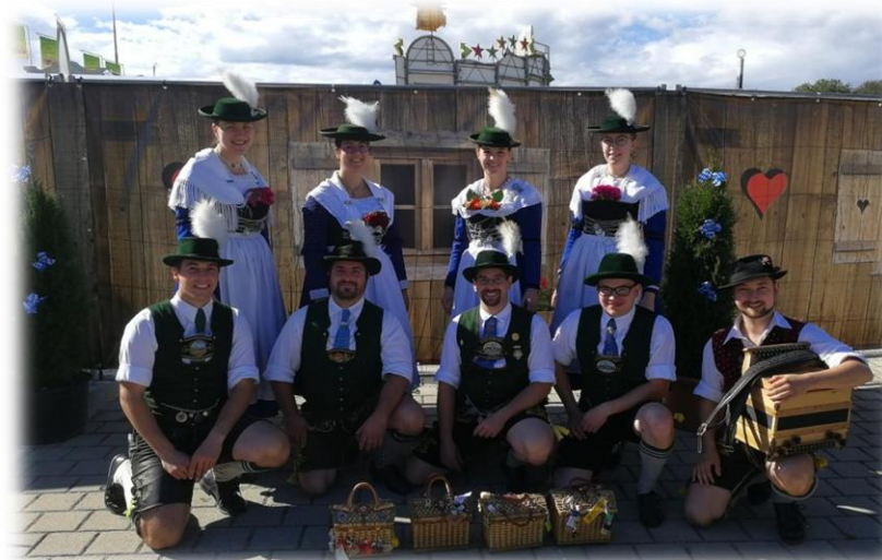
Schanzer Herbstvergnügen Ingolstadt